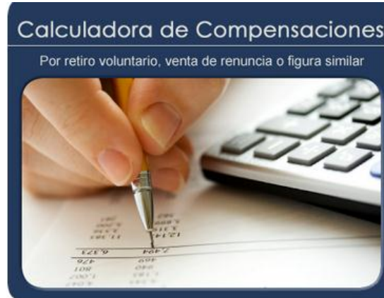
Ilustración 5. Ejemplo

Caso contrario si existirá devolución de compensación, inclusive cuando falte 1 día para que transcurran 7 años, véase en el siguiente Ejemplo: