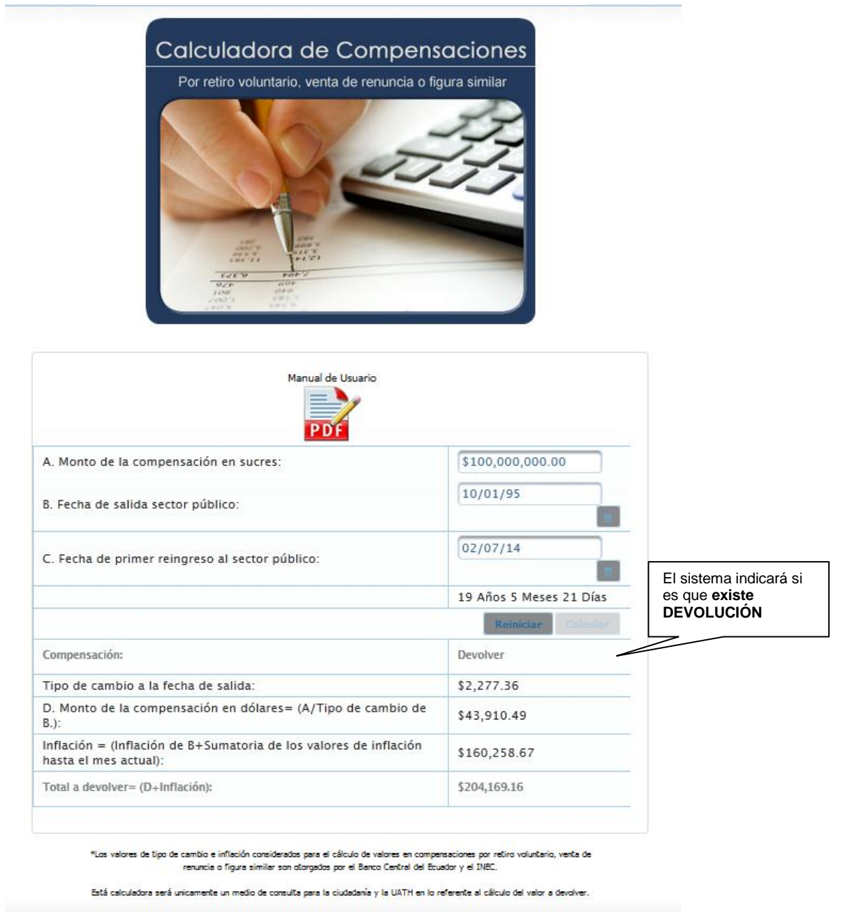
Ilustración 3. Vista cuando se devuelve la compensación