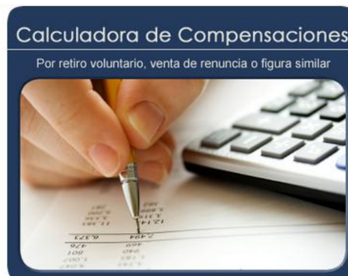
Ilustración 6. Vista de los valores del monto de la compensación en dólares y del total a devolver.