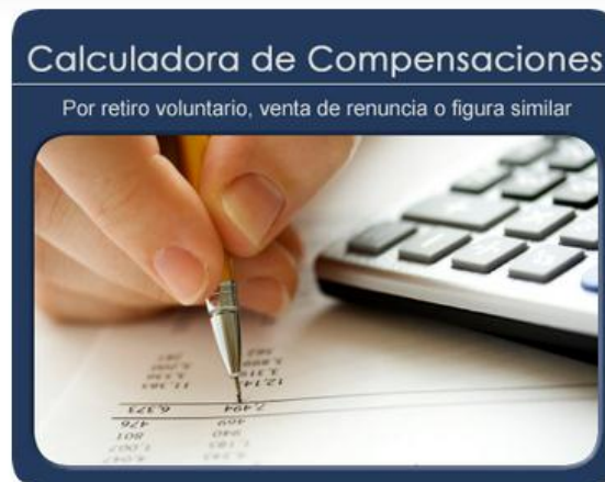
Ilustración 1. Ingresar el monto de la compensación en sucres.